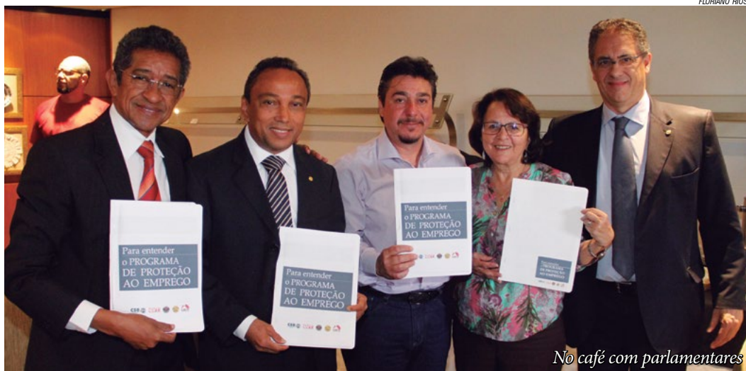
No café com parlamentares

O presidente do Sindicato também conversou com o deputado federal pelo PT da Bahia, Afonso Florence, e o senador pelo PT do Pará, Paulo Rocha, no último dia 19 na capital.