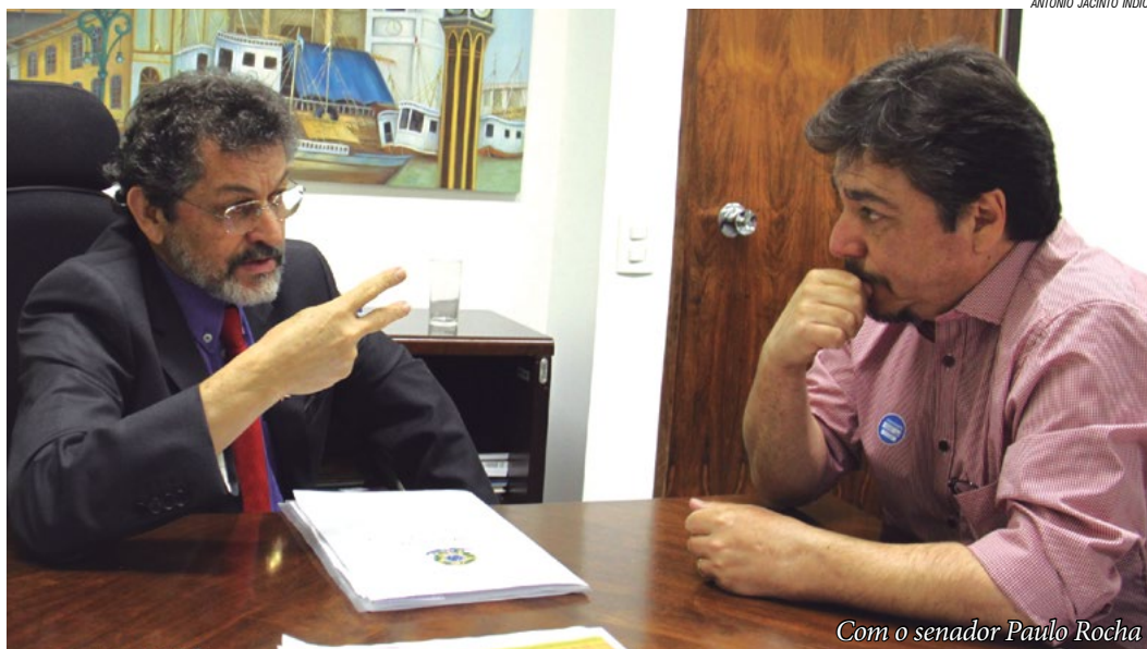
Com o senador Paulo Rocha